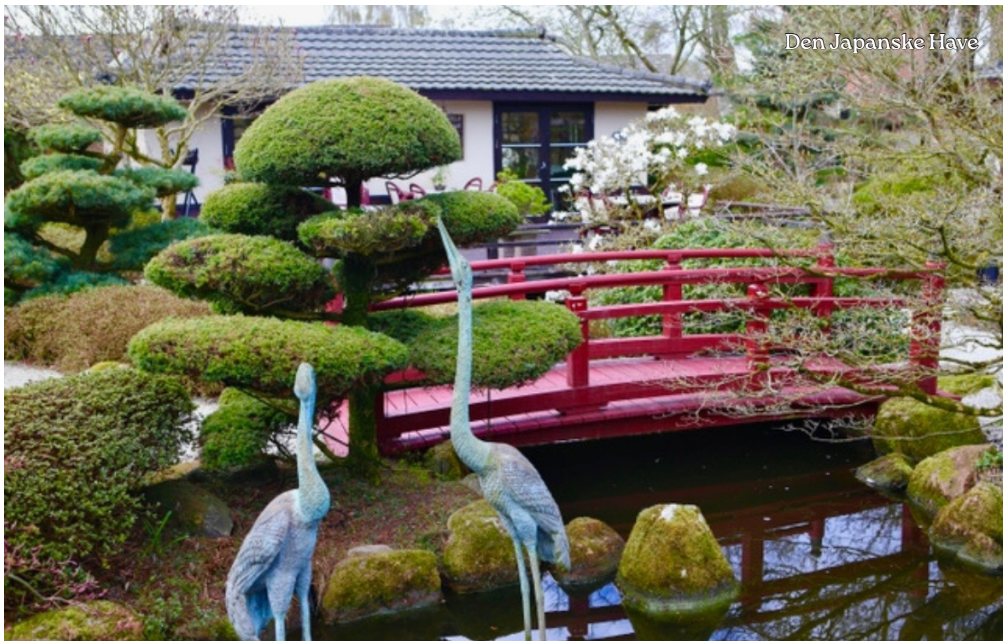
Den Japanske Have